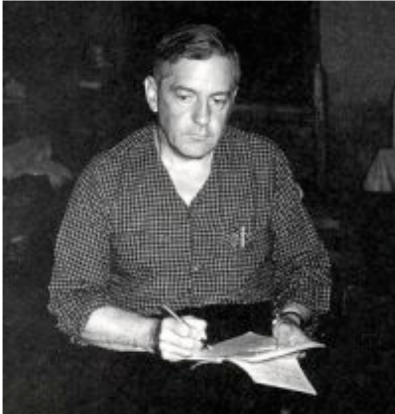
Robert Gordon Wasson, 1957